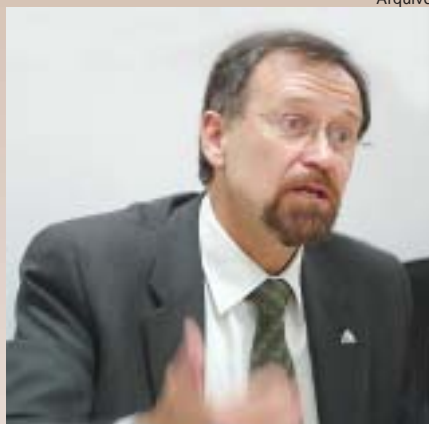
Arquivo José Luiz Amaral: sugestões para a Ordem

“Será necessário muito cuidado e atenção para que, nesta fusão entre as entidades não, percamos nossa autono-