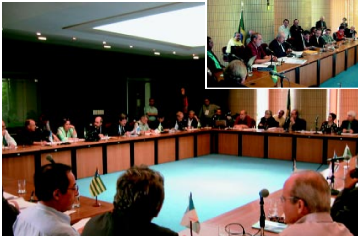
Sede do CFM, em Brasília: reunião entre as Comissões Estaduais e a Comissão Nacional de Implantação

As discussões sobre o novo rol de procedimentos médicos da Agência Nacional de Saúde Suplementar (comunicado ao lado), a tramitação do Projeto de Lei nº 3466, que referencia a Classificação Brasileira Hierarquizada de Procedimentos Médicos (CBHPM) no âmbito da saúde suplementar, a ação da Unimed de Uberlândia contra a CBHPM e as novas propostas e ações para a sua implantação em nível nacional foram os principais assuntos discutidos durante a reunião entre os presidentes e representantes das Comissões Estaduais de Honorários Médicos e a Comissão Nacional de Implantação da CBHPM (CNI), realizada no dia 14 de outubro, na sede do Conselho Federal de Medicina, em Brasília.