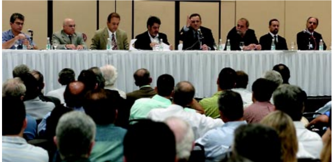
Assembléia em Uberlândia reuniu cerca de 500 cooperados da Unimed