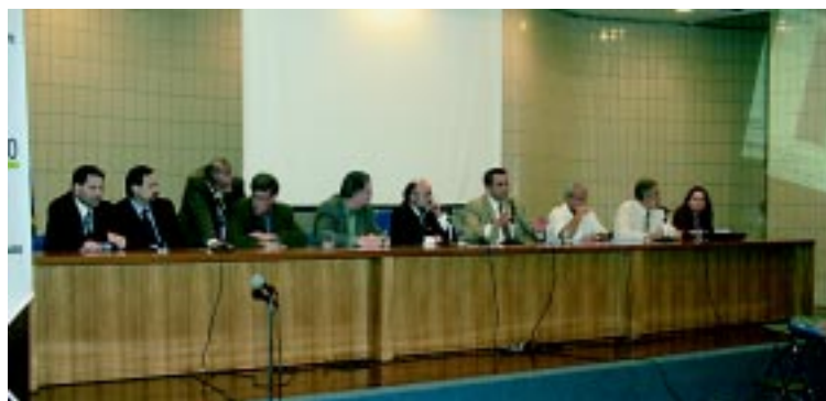
Debate sobre Ato Médico em Brasília

As atitudes dos estudantes frente ao Ato Médico mostraram-se, predominantemente, positivas (91%), não constituindo tentativa de elitizar a profissão médica, frente às demais (64,6%). Dos estudantes ouvidos, 81,5% concordam que o projeto de lei serve para evitar que não médicos enganem a população. A segurança à população é reafirmada, quando 89% dos estudantes afirmam que o projeto de lei garante que os pacientes não serão expostos a graves riscos nas mãos de pessoas não habilitadas; e 89,7% dos entrevistados concordam que o projeto é