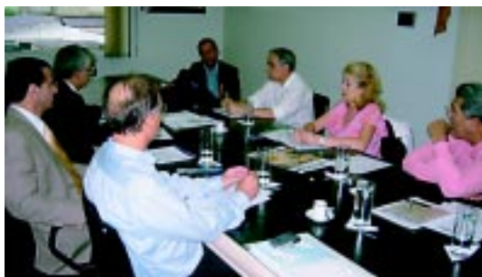
Reunião da Comissão de Estudos da Ordem dos Médicos