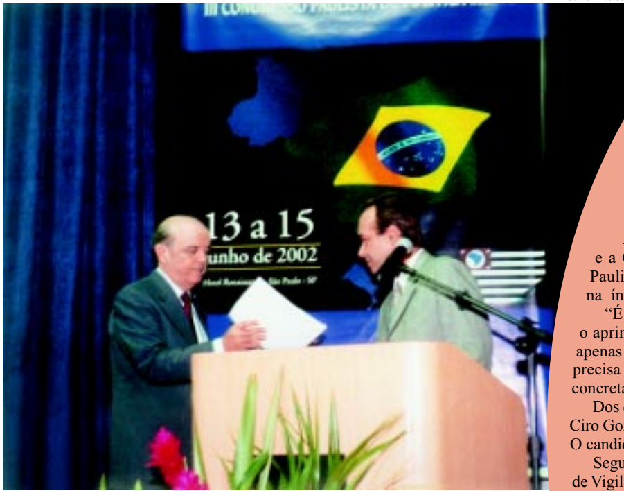
O presidente da AMB, Eleuses Paiva, entrega ao candidato José Serra, carta com propostas das entidades médicas para a área de saúde