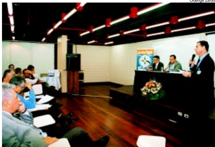
Diretoria Plena: Vice-presidentes realizaram balanço do trabalho desenvolvido na atual gestão

Diretoria Plena propõe novas estratégias de atuação no próximo mandato