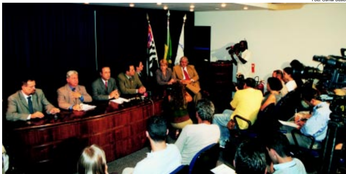
Entidades médicas reunidas: mobilização contra os limites dos convênios