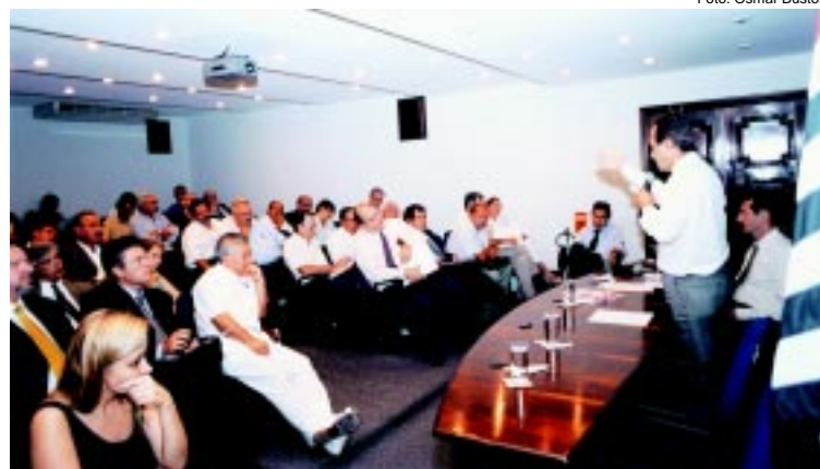
Conselho Científico: proposta final para regulamentar a qualificação do médico especialista e disciplinar exercício das especialidades no País

Para o presidente da AMB, a aprovação do projeto da forma como