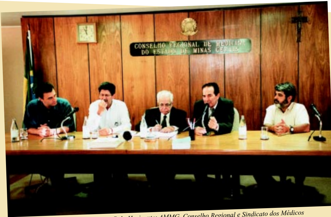
Coletiva de imprensa em Belo Horizonte: AMMG, Conselho Regional e Sindicato dos Médicos posicionam-se contra a abertura do curso de medicina de Caratinga

A Associação Médica de Minas Gerais, o Conselho Regional de Medicina e o Sindicato dos Médicos de Minas Gerais ingressaram na Justiça com um mandado de segurança contra o decreto do governador Itamar Franco que autoriza o funcionamento da Faculdade de Medicina de Caratinga. As entidades também pedem que seja